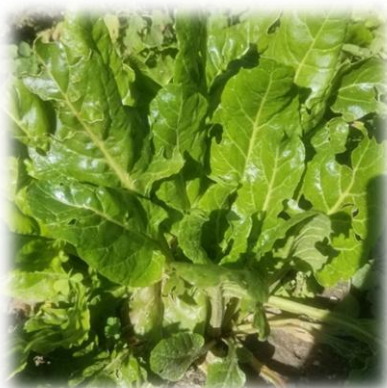
Les bettes ou blettes, Beta vulgaris AMARANTHACEAE

Les bettes aiment la chaleur et l'air sec, et on en trouve beaucoup à l'état spontané en Méditerranée.