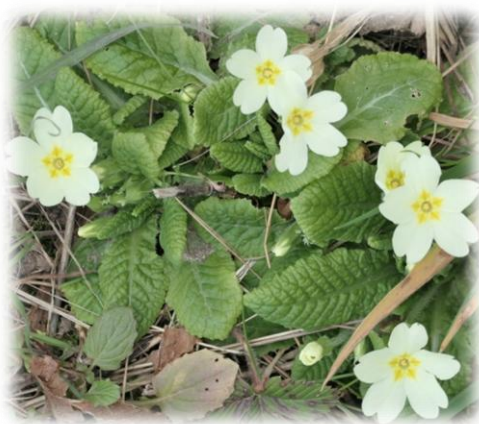
Primevère acaule Primula vulgaris PRIMULACEAE

Ça y est les premières fleurs de primevères sauvages sont de sortie et embellissent les talus ombragés !